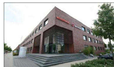
Stockholmer Allee 32 (voll vermietet durch CUBION)