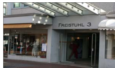
Freistuhl 3 (Rätia Energie mietete über CUBION)