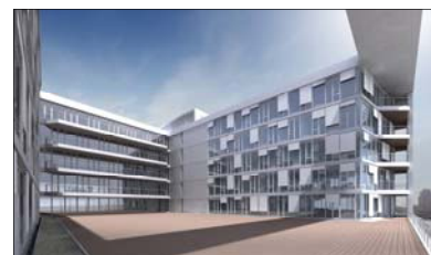
Vapiano mietet über CUBION im „H2-Office“