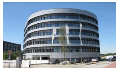
„Looper“: Weitere 750 m 2 durch CUBION vermietet