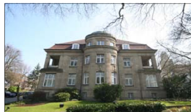
Villa Koppers (Exklusivbeauftragung CUBION)