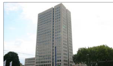
Westfalendamm 87, (WestfalenTower)