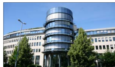
Westfalen Center Dortmund